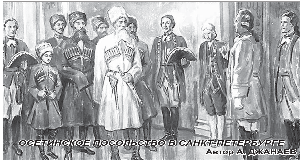
ОСЕТИНСКОЕ ПОСОЛЬСТВО В САНКТ-ПЕТЕРБУРГЕ Автор А. ДЖАНАЕВ

тербурга осетинское посольство добиралось 4 месяца, но, к сожалению, доехали не все послы.